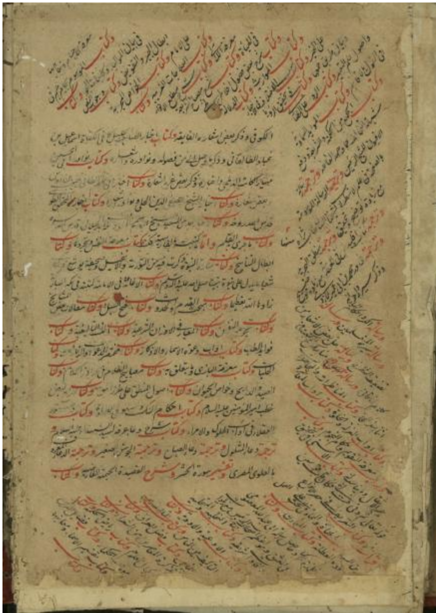
عکس یکی از صفحات تذکره حزین به خط خود