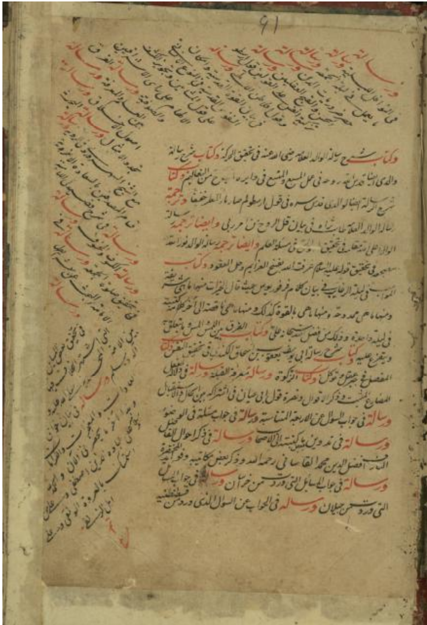
عکس یکی از صفحات تذکره حزین به خط خود